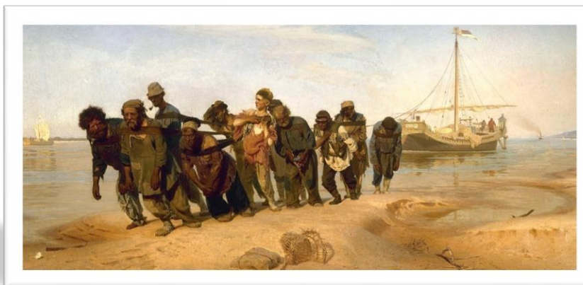
ФИО, Название техника, размер, год создания