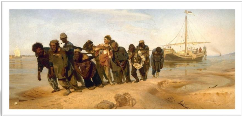
ФИО, Название техника, размер, год создания