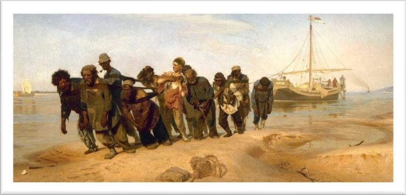
Название, дата, тема