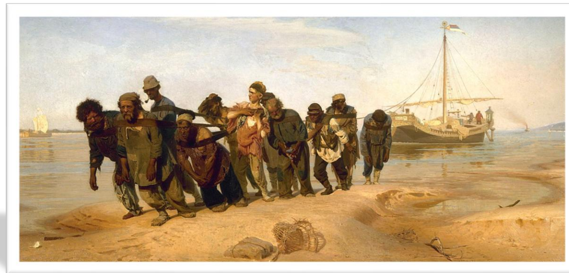
ФИО, Название техника, размер, год создания