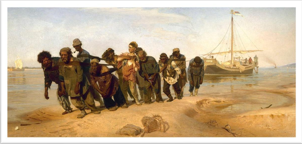
Название, дата, тема